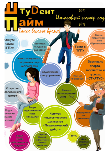
Первый номер «ШТ», сентябрь, 2007 год и первый номер «ШТ» в новой редакции, 2015 год