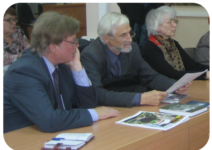
Презентация студенческой газеты «Штудент Тайм» ТГПУ в библиотеке им. А.С. Пушкина